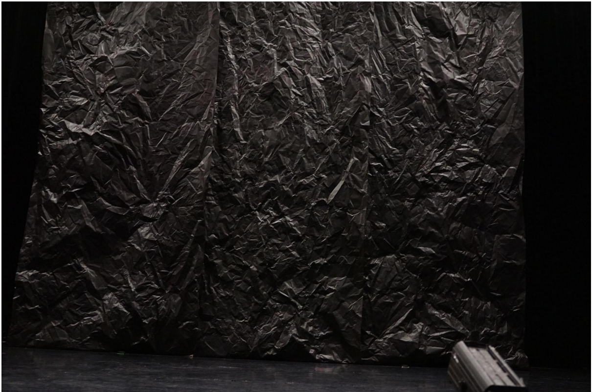
PHOTO DU DÉCOR